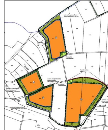
Abb. Geplantes Vorhaben, nicht maßstäblich

Die Lage und Abgrenzung ist aus dem nachfolgenden Kartenausschnitt ersichtlich (maßstabslos). Dieser Bereich soll als Sondergebiet ausgewiesen werden.