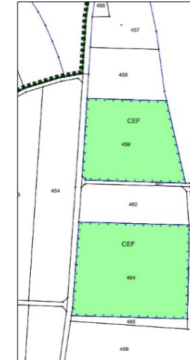
Abb. Externe Ausgleichsflächen Fl.Nr. 459, 464 Gmk. Heuberg, nicht maßstäblich

Ziel der Planung ist die Ausweisung eines Sondergebietes für eine Freiflächen-Photovoltaikanlage innerhalb eines nach dem Erneuerbaren-Energien-Gesetzes „landwirtschaftlich benachteiligten Gebietes“, um dem Bedarf an erneuerbaren Energien zu entsprechen.