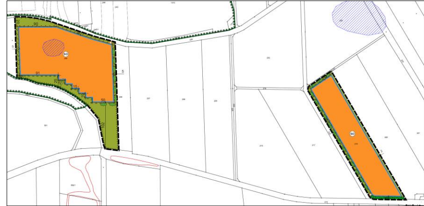
Abb. Geplantes Vorhaben, nicht maßstäblich

Die Lage und Abgrenzung ist aus dem nachfolgenden Kartenausschnitt ersichtlich (maßstabslos). Dieser Bereich soll als Sondergebiet ausgewiesen werden.