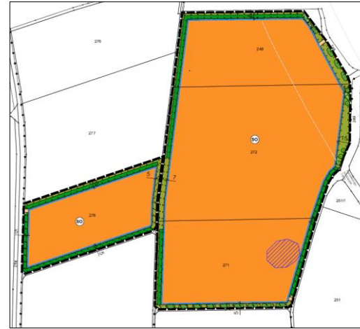
Abb. Geplantes Vorhaben, nicht maßstäblich

Die Lage und Abgrenzung ist aus dem nachfolgenden Kartenausschnitt ersichtlich (maßstabslos). Dieser Bereich soll als Sondergebiet ausgewiesen werden.