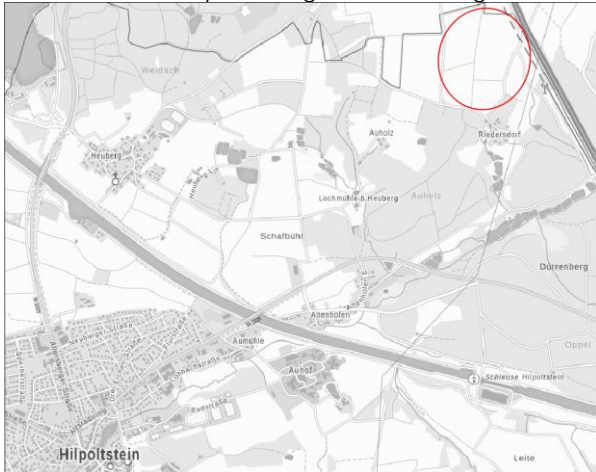
Abb. Übersicht Lage des Vorhabens nicht maßstäblich

Der Geltungsbereich liegt im nordöstlichen Stadtgebiet von Hilpoltstein (Landkreis Roth, Regierungsbezirk Mittelfranken) siehe folgende Abbildung.