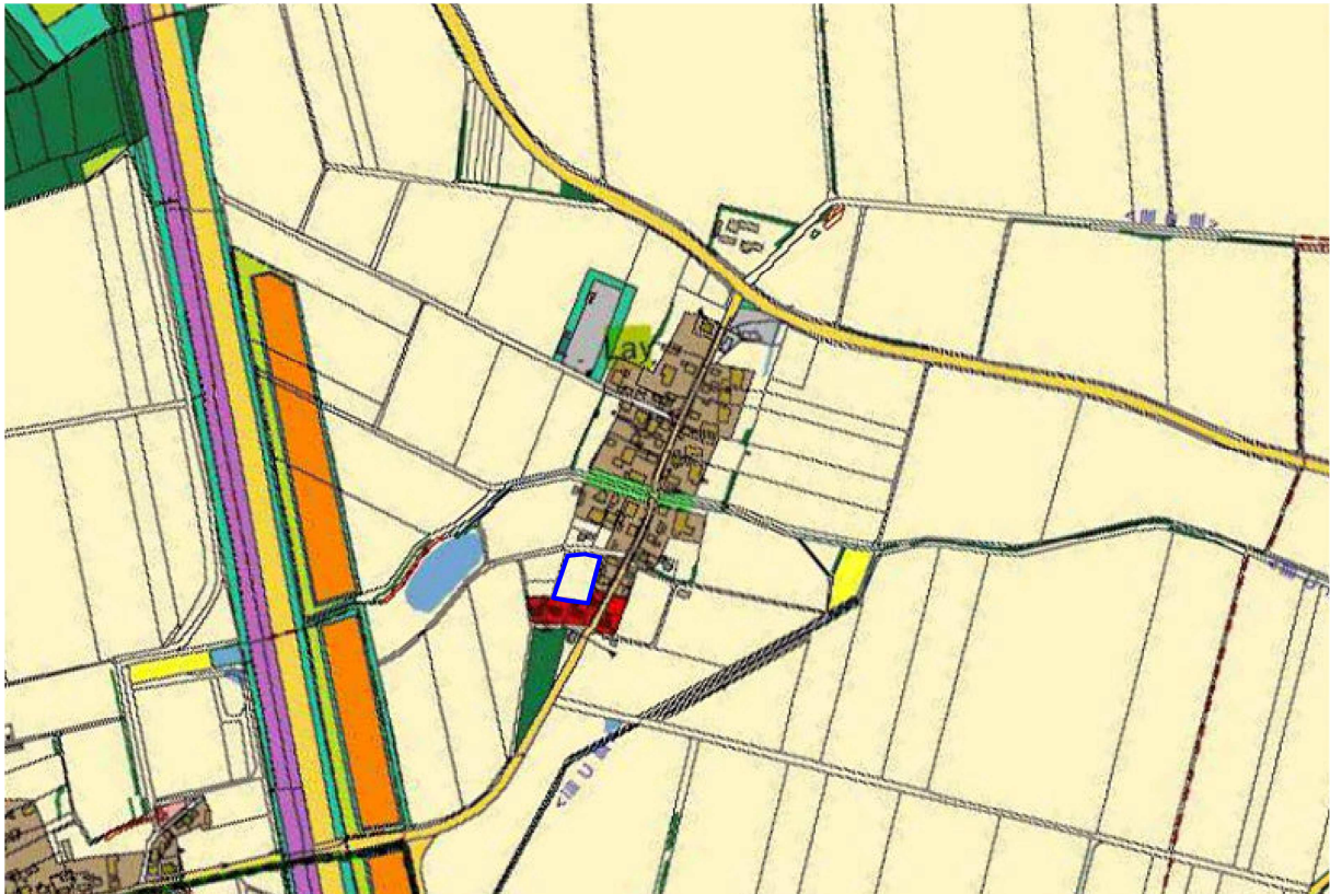
Abbildung 2: Aktuell rechtswirksamer Flächennutzungsplan der Stadt Hilpoltstein, Ortsteil Lay (Geltungsbereich blau umrandet); ohne Maßstab