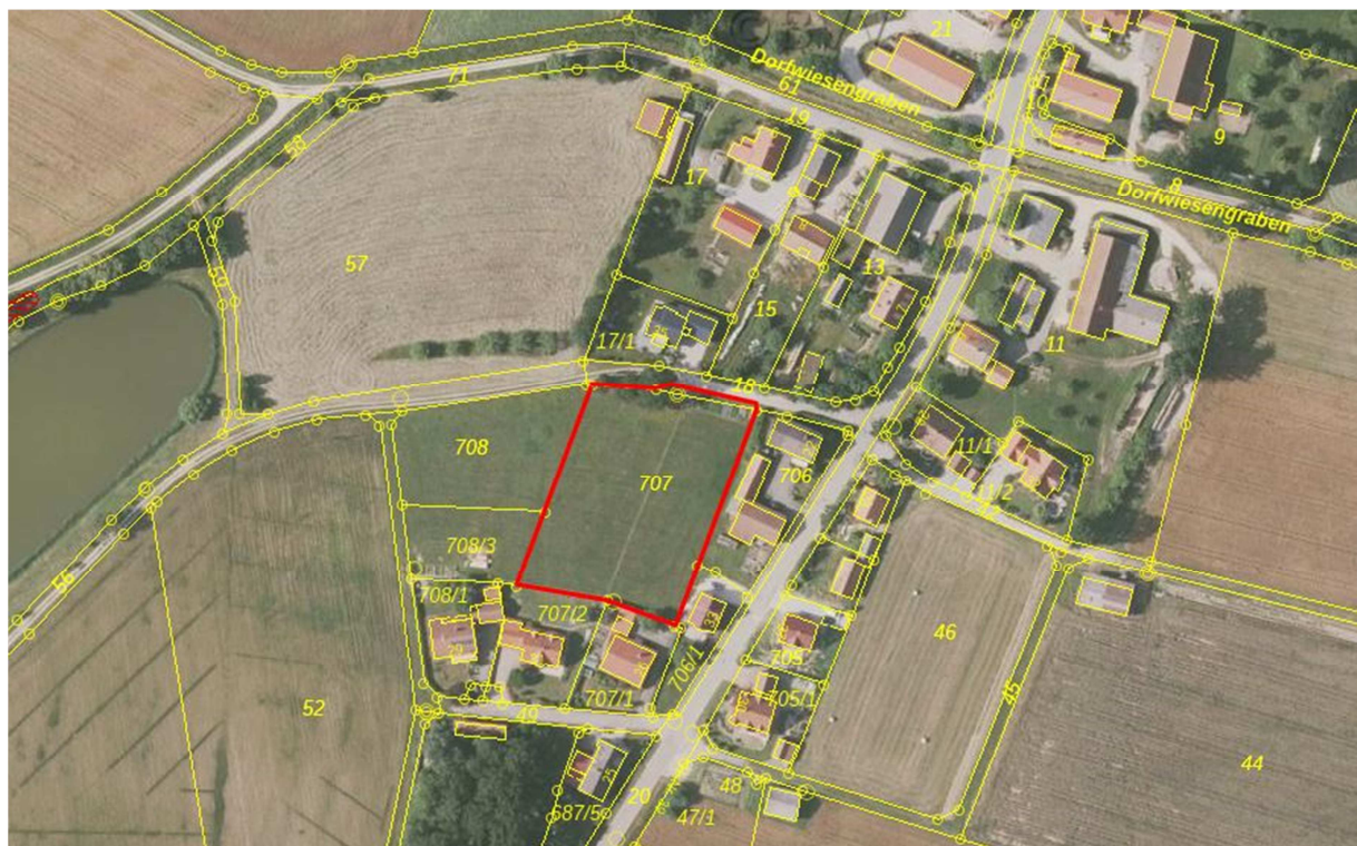
Abbildung 3: Luftbild des Geltungsbereichs

Der Geltungsbereich wird aktuell überwiegend als Intensivgrünland landwirtschaftlich bewirtschaftet (vgl. Abbildung 3). Etwa mittig verläuft ein schmaler, mit trittresistenten Grünlandarten bewachsener Pfad. Ein paar kleine Nutzbeete auf der kleinen Böschung am nordöstlichen Rand des Geltungsbereich liegen zurzeit brach, sodass einzelne durchgewachsene Stauden, abgeblühte Sonnenblumen o.a. kleinflächig Struktur bieten. Der Geltungsbereich weist damit überwiegend geringe Bedeutung für Natur und Landschaft auf. Aufgrund der Ortsnähe und der angrenzenden Vertikalstrukturen wird eine Eignung als Brutstandort für Bodenbrüter ausgeschlossen. Greifvögeln, verschiedenen Schwalbenarten, Fledermäusen und anderen Arten kann die Fläche jedoch als Nahrungshabitat dienen (vgl. Kapitel 6).