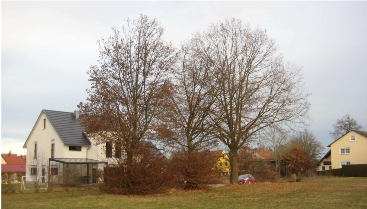
Abbildung 4: Markante Bäume am nordwestlichen Rand des Geltungsbereichs (Aufnahme vom 08.12.2020)

Höherwertig einzustufen sind die drei markanten Bäume am nordwestlichen Rand des Geltungsbereichs (vgl. Abbildung 4).