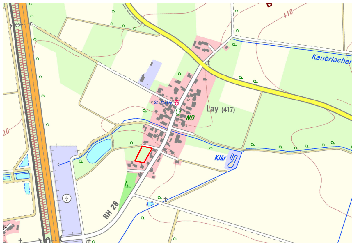
Abbildung 1: Lage des geplanten Baugebiets im Südwesten von Lay (Ausschnitt aus der TK25, ohne Maßstab)

reichs. Die Geländeneigung beträgt im Mittel weniger als 1 %, lediglich im Nordosten besteht eine leicht abfallende Böschung zum angrenzenden Erschließungsweg. Die genauen topografischen Verhältnisse sind den im Planblatt dargestellten Höhenschichtlinien zu entnehmen.