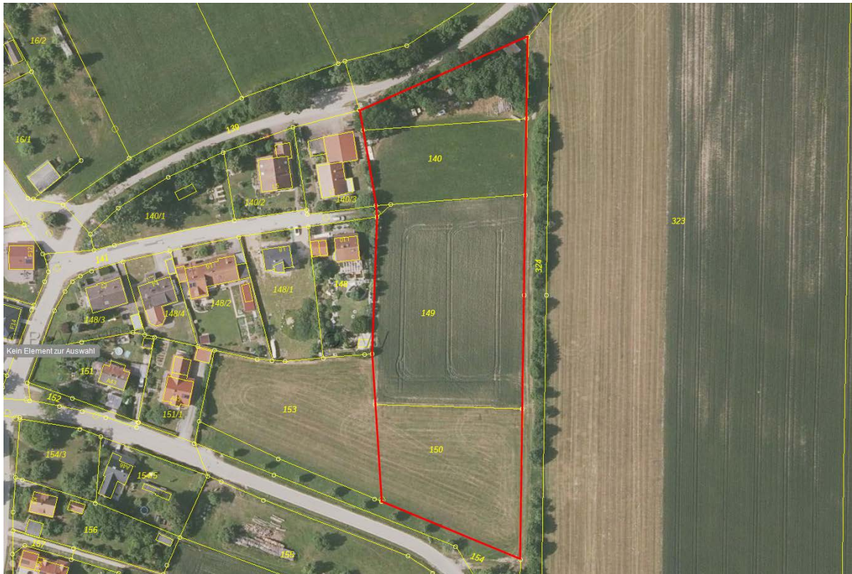
Abb. 2 : Luftbild Änderungsbereich