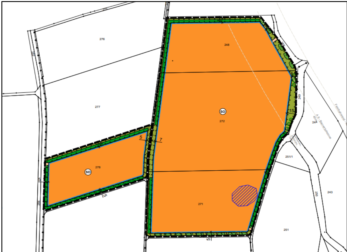
Abbildung 1: Umgrenzung der geplanten PV-Anlage nördlich von Riedersdorf in der Gemarkung Lampersdorf