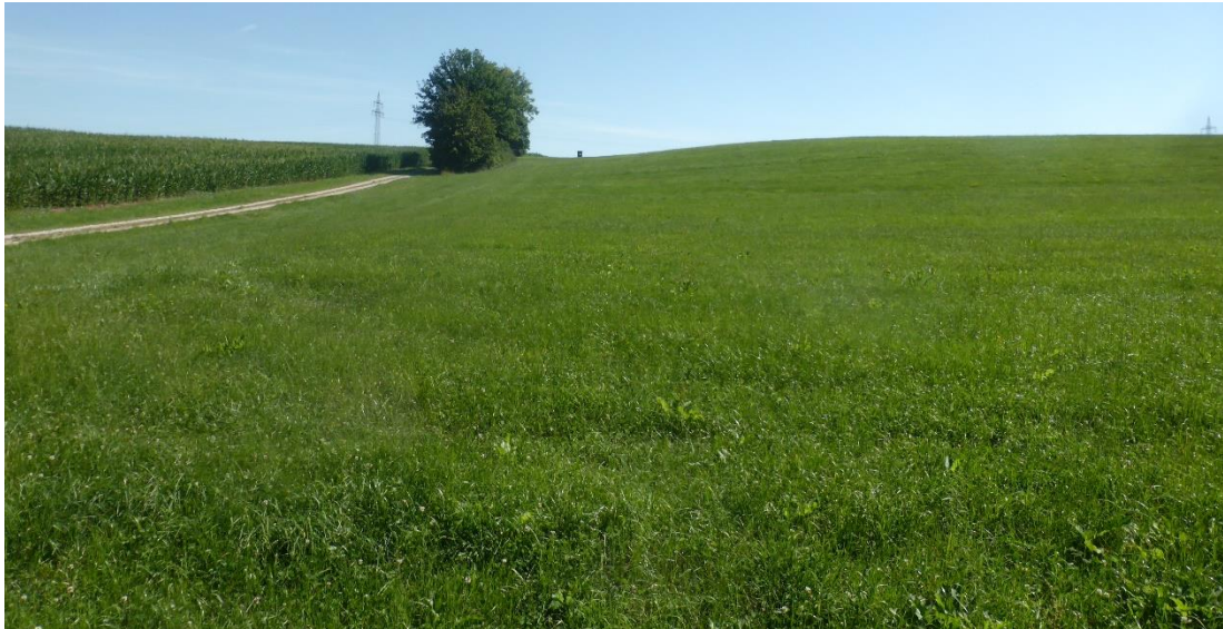
Abbildung: Artenarmes Grünland im Südwesten, im Bereich der Flur-Nr. 88 und 89 und Baum-Strauchhecke südlich eines Wirtschaftswegs (Blickrichtung Nordost)

Neben der großflächigen intensiven landwirtschaftlichen Nutzung bestehen weitere Beeinträchtigungen durch die Staatstraße St 2238 und den Hochspannungsleitungen 110KV und 20 KV.