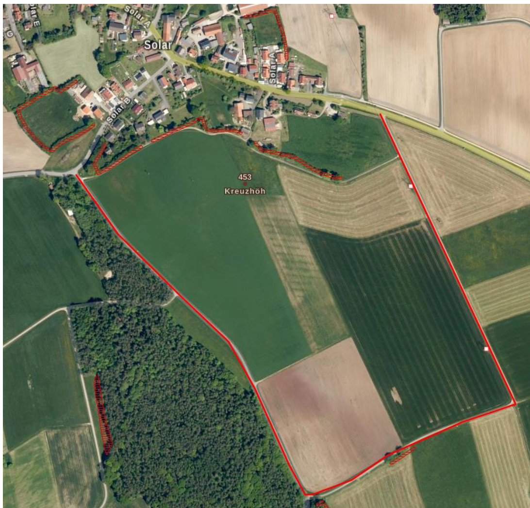
Zufahrten zum geplanten Sondergebiet

Die Erschließung des geplanten Solarparks erfolgt über die St 2238 und von dort über den OT Solar über befestigte Flurbereinigungsweg nach Süden (siehe folgende Abbildung). Die Mündungsbereich der Feldwege zum öffentlichen Straßennetz sind ausreichend breit ausgebaut.