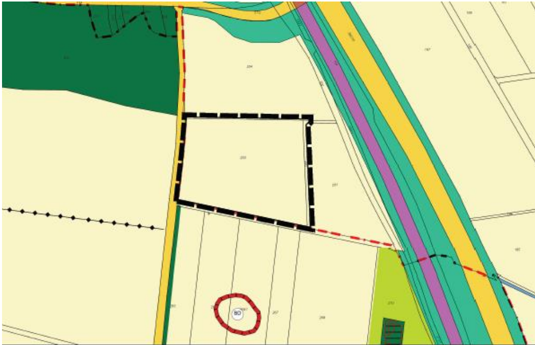
Ausschnitt aus dem wirksamen Flächennutzungsplanes mit Abgrenzung des Änderungsbereiches (nicht maßstäblich)

Die Stadt Hilpoltstein verfügt über einen Flächennutzungsplan mit Landschaftsplan. (wirksam 04.12.2000). Dieser stellt für das Plangebiet Flächen für die Landwirtschaft dar.