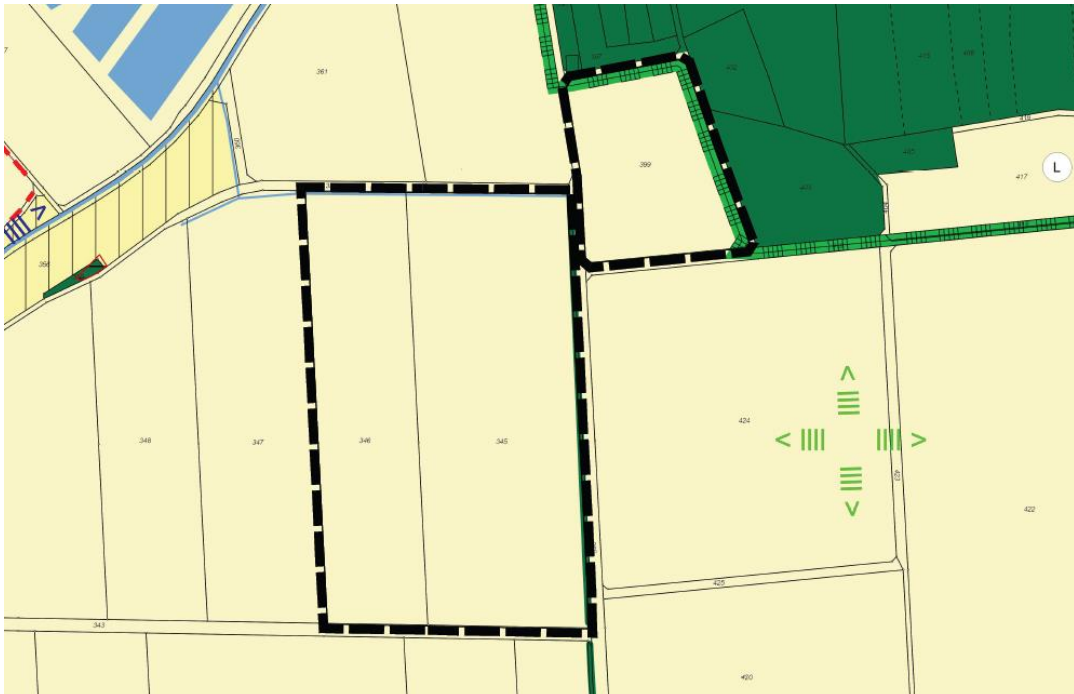
Ausschnitt aus dem wirksamen Flächennutzungsplanes mit Abgrenzung des Änderungsbereiches (nicht maßstäblich)

Die Stadt Hilpoltstein verfügt über einen Flächennutzungsplan mit Landschaftsplan. (wirksam 04.12.2000). Dieser stellt für das Plangebiet Flächen für die Landwirtschaft dar.