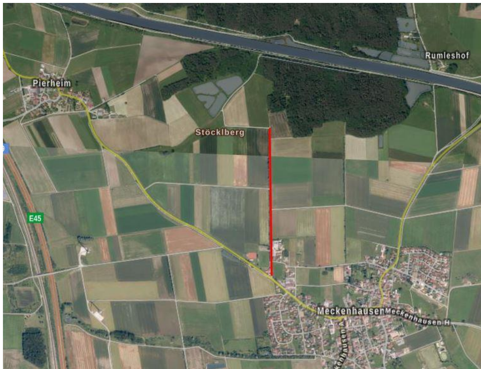
Zufahrt zum geplanten Sondergebiet

Die Erschließung des geplanten Solarparks erfolgt über die Gemeindeverbindungsstraße von Meckenhausen nach Pierheim und über befestigte Flurbereinigungswege nach Norden auf die jeweiligen Teilflächen des Geltungsbereiches (siehe folgende Abbildung).