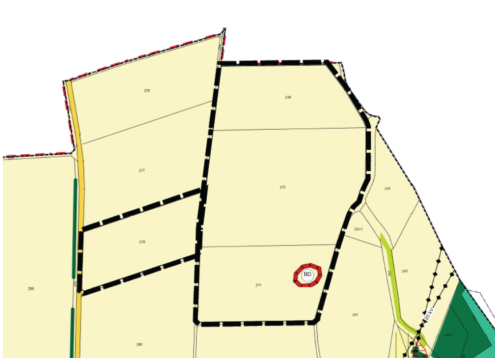
Ausschnitt aus dem wirksamen Flächennutzungsplanes mit Abgrenzung des Änderungsbereiches (nicht maßstäblich)

Die Stadt Hilpoltstein verfügt über einen Flächennutzungsplan mit Landschaftsplan. (wirksam 04.12.2000). Dieser stellt für das Plangebiet Flächen für die Landwirtschaft dar.