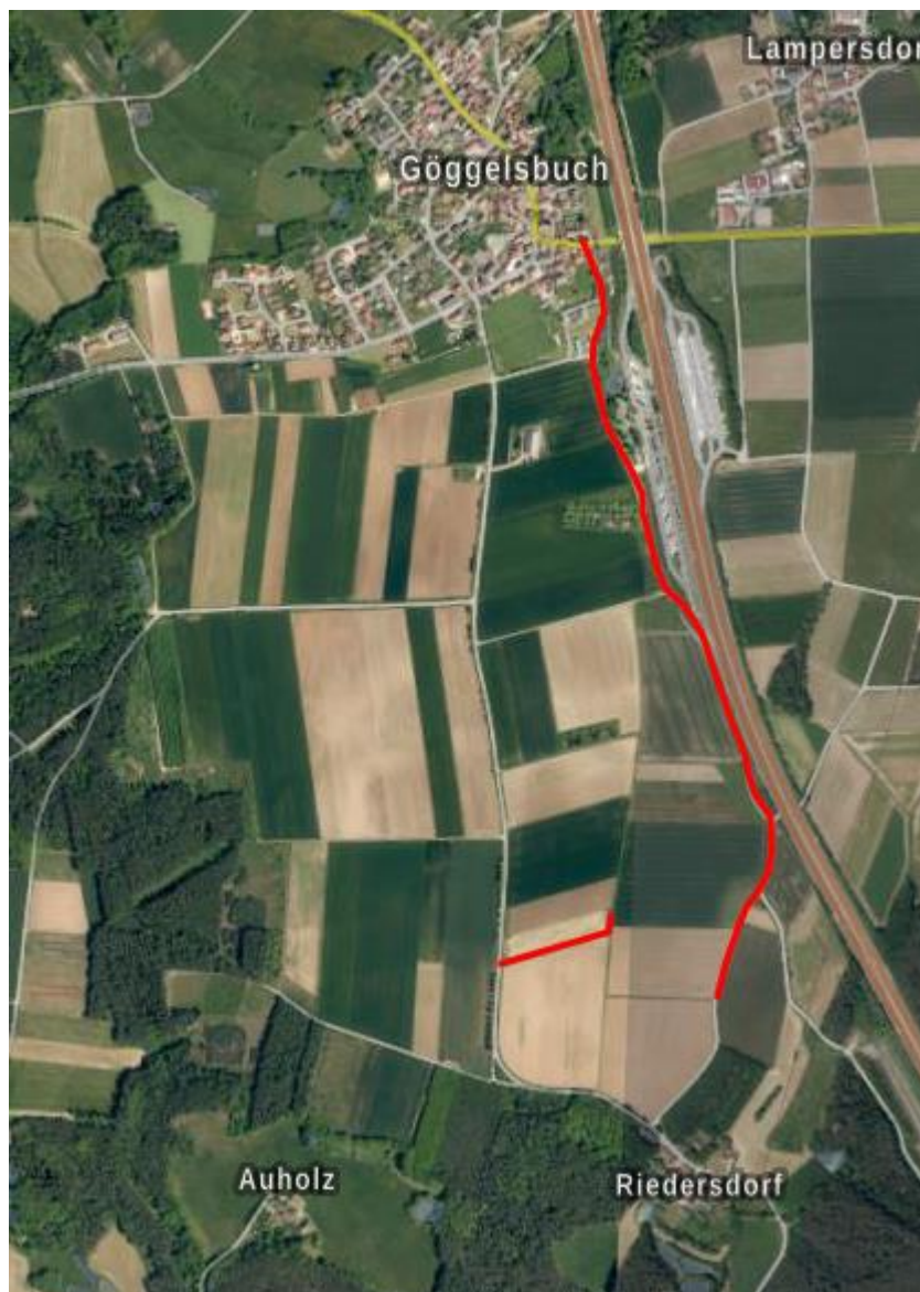
Zufahrten zum geplanten Sondergebiet

Die Erschließung des geplanten Solarparks erfolgt über die RH 8 und von dort über die Gemeindeverbindungsstraße von Göggelsbuch nach Riedersdorf und über den befestigten Flurbereinigungsweg südlich von Göggelsbuch entlang der BAB A 9 (siehe folgende Abbildung).