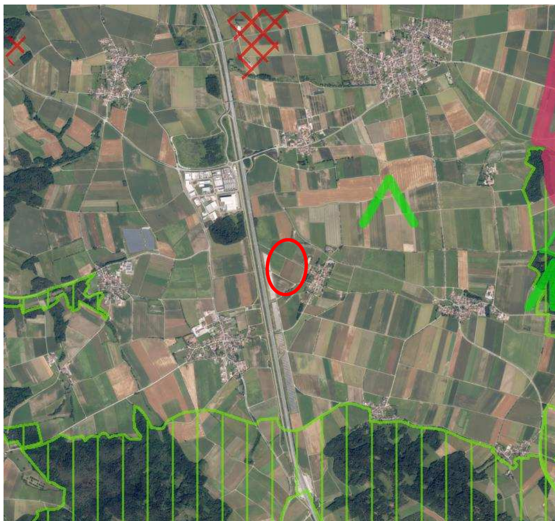
Abb. 2: Ausschnitt aus dem Regionalplan (Rauminformationssystem Bayern RISBY, 2022)

Anlagen ohne Siedlungsanbindung können nur in Betracht kommen, wenn „... Möglichkeiten der geforderten Anbindung nicht gegeben sind, keine erheblichen Beeinträchtigungen des Orts- und Landschaftsbildes mit dem jeweiligen Vorhaben verbunden sind und sonstige öffentliche Belange nicht entgegenstehen.“ (zu 6.2.2.3 Begründung).