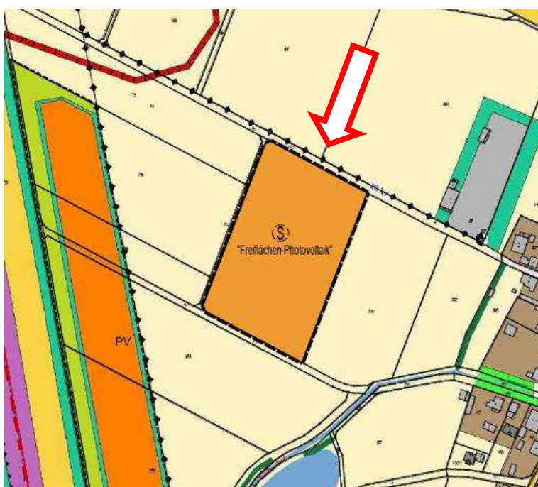
Abb. 4: Übersicht des Bereiches der 22. Flächennutzungsplanänderung