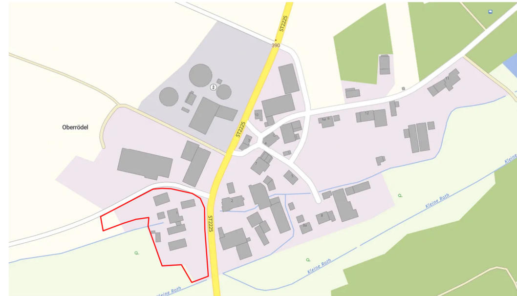
Karte des räumlichen Geltungsbereichs o. M.

Das Plangebiet des vorhabenbezogenen Bebauungsplans Oberrödel Nr. 1 umfasst das Grundstück mit der Fl.Nr. 589 der Gemarkung Tiefenbach und weist eine Fläche von etwa 0,6 ha auf.