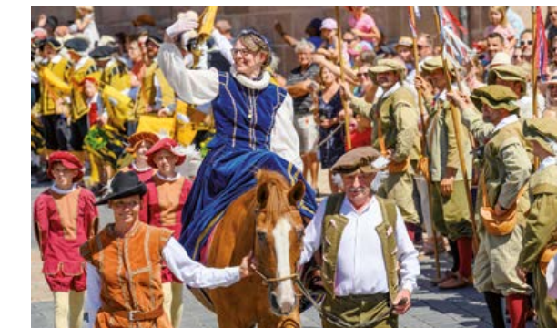
Hilpoltsteiner Burgfest (Einzug der Pfalzgräfin)

Regiert wurde die junge Pfalz, zu der Hilpoltstein gehörte, jedoch durch ihren Neffen, Pfalzgraf Johann Friedrich, mit dem sie sich gut verstand. Dessen Residenz, das untere Schloss, liegt am heutigen Marktplatz. Sie ist für Besucher geöffnet und beherbergt unter anderem die Tourist-Information. Im ebenfalls am Marktplatz gelegenen Museum „Schwarzes Roß“ finden sich viele Ausstellungsstücke zur Burg und auch ein Modell, anhand dessen die einst stattliche Größe der Anlage erahnt werden kann.