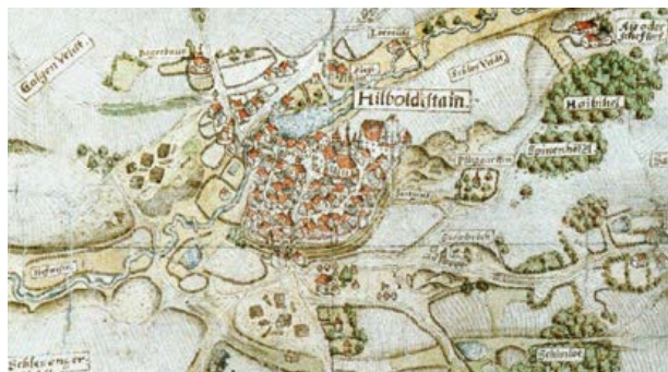
Vogelsche Karte von 1604

Weitere Informationen unter www.hilpoltstein.de/burg